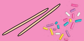
Stiele und bunte Streusel