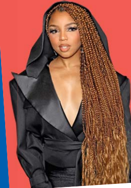
Chloe Bailey Sängerin, 25 Jahre