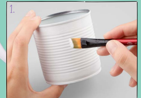
1. Bepinsel die Dose von außen komplett mit der weißen Farbe und lasse sie gut trocknen.