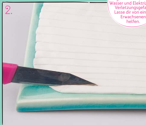
2. Schneide dünne Streifen (ca. 1 cm breit) aus der Masse. Für jeden Muffin brauchst du jeweils ungefähr acht Streifen.