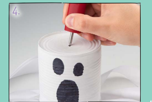
4. Jetzt stichst du mit dem Dosenlocher vorsichtig ein Loch in den Dosenboden. Fädle ein Band für die Aufhängung durch das Loch und verknote es in der Dose, sodass es nicht herausrutschen kann. Booohoo!