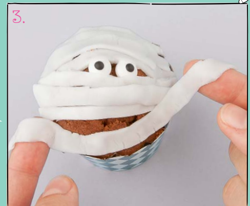
3. Mit etwas Fondant drückst du nun die Augen auf den Muffin und legst die Streifen leicht überlappend drum herum, bis alles bedeckt ist.