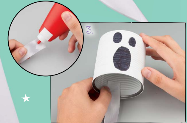
3. Schneide von dem weißen Schleifenband mehrere ca. 50 Zentimeter lange Streifen ab. Klebe diese von innen an den Dosenrand.