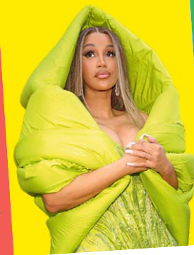
Cardi B Sängerin, 31 Jahre