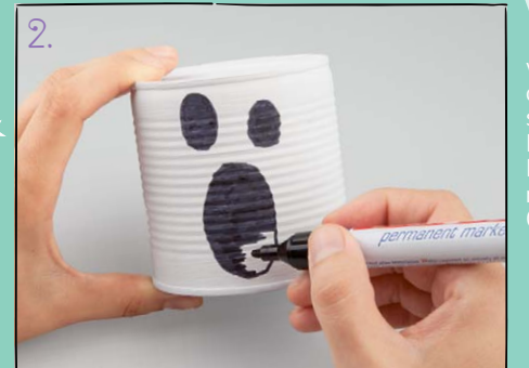
2. Drehe die Dose mit der Öffnung nach unten und male mit dem schwarzen Stift ein Gesicht aus drei ovalen Kreisen auf.