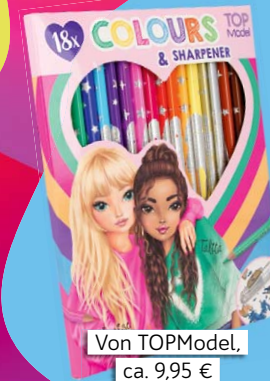
Von TOPModel, ca. 9,95 €

Ich habe in letzter Zeit so viel gemalt, dass es Zeit für eine neue Packung Buntstifte war. Das Besondere: In diesem Set mit 18 verschiedenen Farben ist sogar Gold und Silber dabei. Sooo schön! Außerdem passen die Stifte perfekt als Nachschub in die 3-Fach-Federtaschen von TOPModel. Und ein Anspitzer ist auch dabei, cool!