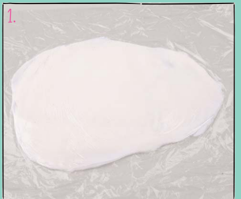
1. Lege den Fondant zwischen Backpapier oder Frischhaltefolie und rolle ihn mit einem Nudelholz flach aus.