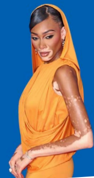
Winnie Harlow Model, 29 Jahre