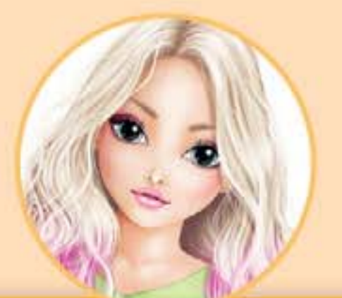
June Die Schüchterne