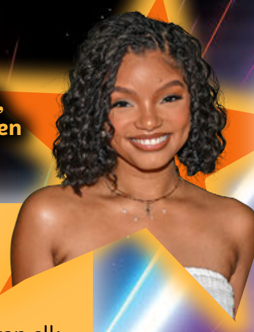
Halle Bailey (24), 27 maart, actrice en zangeres