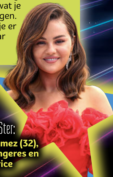
Ster: Selena Gomez (32), 22 juli, zangeres en actrice

Heeft je BFF je even hard nodig? Je weet precies wat je moet zeggen. Super dat je er voor haar bent!