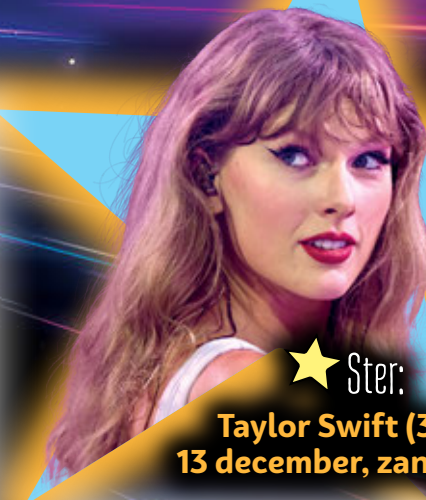
Ster: Taylor Swift (34), 13 december, zangeres