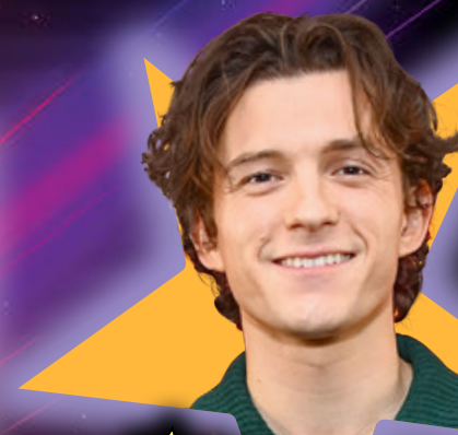
Ster: Tom Holland (28), 1 juni, acteur

Op school beginnen jullie aan iets nieuws dat je best lastig vindt. Maar geen paniek: met wat geduld en logisch nadenken krijg je het absoluut onder de knie!