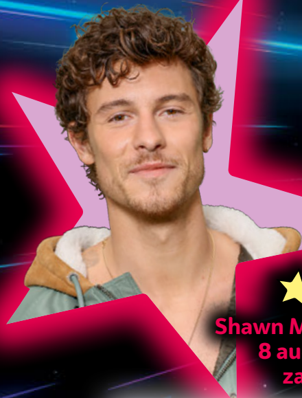
Ster: Shawn Mendes (26), 8 augustus, zanger