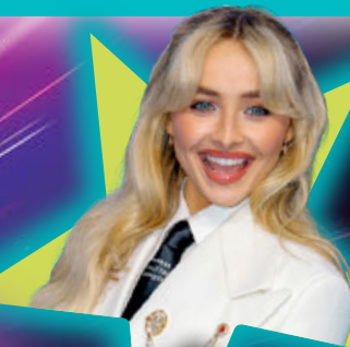
Ster: Sabrina Carpenter (25), 11 mei, zangeres en actrice

Je zit vol met creatieve ideeën! Maak hier gebruik van en ga bijvoorbeeld je kamer opnieuw inrichten. Toffe posters en foto's kunnen al een groot verschil maken.