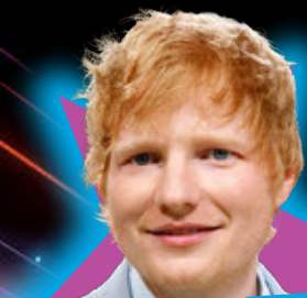
Ster: Ed Sheeran (33), 17 februari, zanger