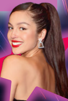
Ster: Olivia Rodrigo (21), 20 februari, actrice en zangeres

Vaak zijn het de kleine dingen die een glimlach op je gezicht toveren. En je waardeert ze allemaal - dat is toch geweldig!