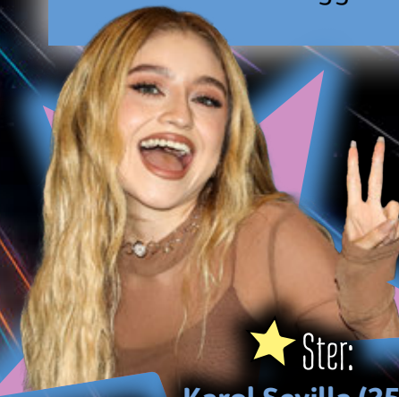
Ster: Karol Sevilla (25), 9 november, zangeres en actrice

Met je geniale en fantasierijke ideeën maak je indruk op je leraren. En ook je klasgenoten luisteren aandachtig naar je vele, coole suggesties.