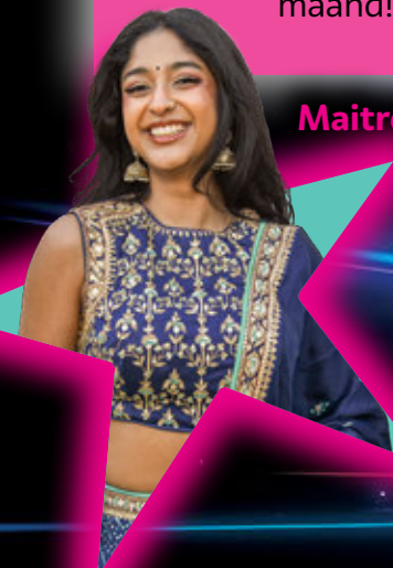
Ster: Maitreyi Ramakrishnan (23), 28 december, actrice

Je drang naar avontuur kent geen grenzen. Je bent zo dapper en dus gaat alles lukken waar je aan begint. Januari wordt een super maand!