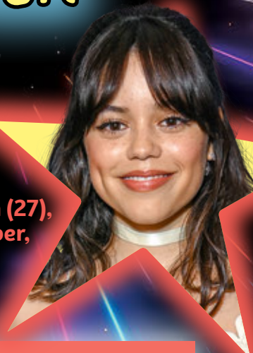
Jenna Ortega (27), 27 september, actrice