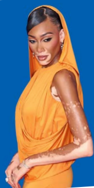
Winnie Harlow model, 29 jaar