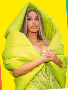
Cardi B zangeres, 31 jaar

Er is een heel bijzondere trend op de rode loper te zien: elegante capuchons! Niet alleen bij hoodies, maar nu ook bij avondjurken zien we verschillende hoofdbedekkingen die bij een jurk horen. Winnie, Chloe en Cardi doen het voor en laten zien hoe geweldig deze look is: voor de helft over het haar gelegd en qua kleur passend bij de jurk. Cool en elegant tegelijkertijd!