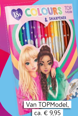
Van TOPModel, ca. € 9,95

Ik heb de laatste tijd zoveel gekleurd, dat het tijd werd voor een nieuw pakje kleurpotloden. Het leuke: in deze set met 18 verschillende kleuren zit zowel goud als zilver. Zo mooi! Daarnaast passen de potloden perfect als navulling in de 3-vaks etuis van TOPModel. En er zit ook nog een puntenslijper bij, cool!