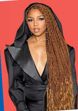
Chloe Bailey zangeres, 25 jaar