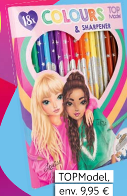
TOPModel, env. 9,95 €

J'ai tellement dessiné ces derniers temps qu'il est temps de me racheter une nouvelle boîte de crayons. La particularité de ce lot de 18 couleurs différentes : il y a même du doré et de l'argenté. C'est trooop joli ! Ces crayons sont d'ailleurs la recharge parfaite pour les trouses à 3 compartiments de TOPModel. Et il y a même une taille-crayon. Cool !