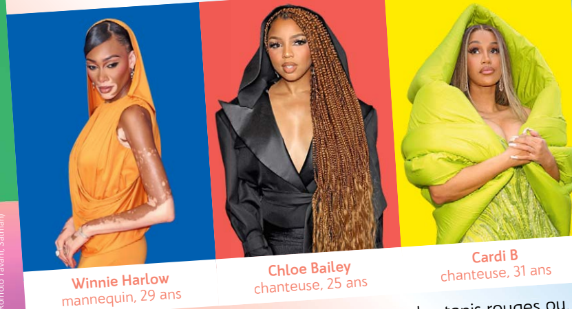
Winnie Harlow mannequin, 29 ans