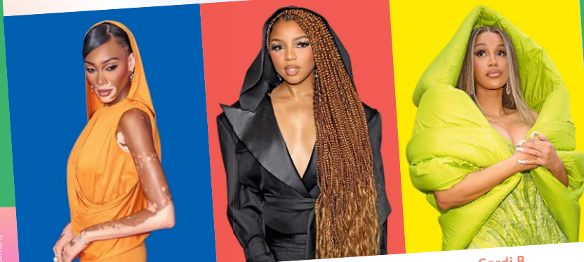
Winnie Harlow Modelo, 29 años