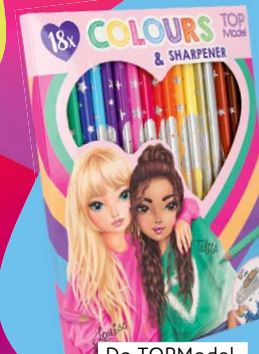
De TOPModel. 9,95 € aprox.

Últimamente había dibujado tanto que llegó el momento de comprar un nuevo set de lápices de color. Muy especial: Este set de 18 lápices diferentes incluye un dorado y un plateado. ¡Taaan chulo! Además, encajan a la perfección en el compartimento del estuche de tres pisos de TOPModel. Y también incluye un sacapuntas, ¡cool!